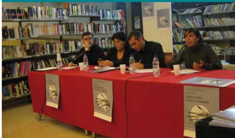
Acte de Causa Comuna a Trinitat Vella