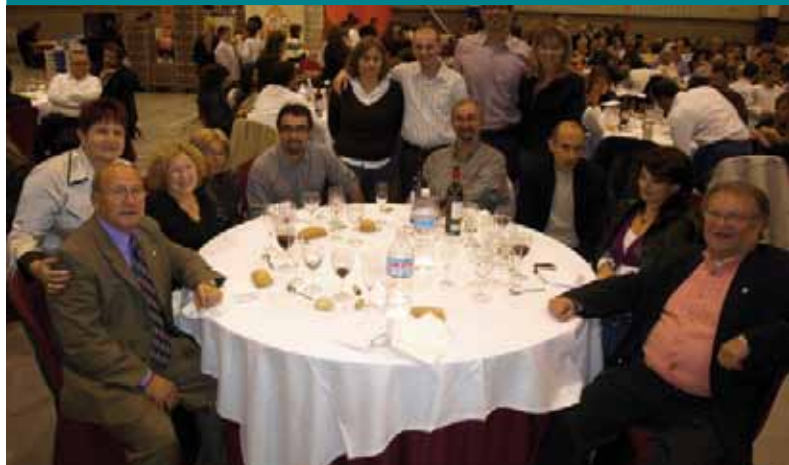
Companys a La nit de l'esport