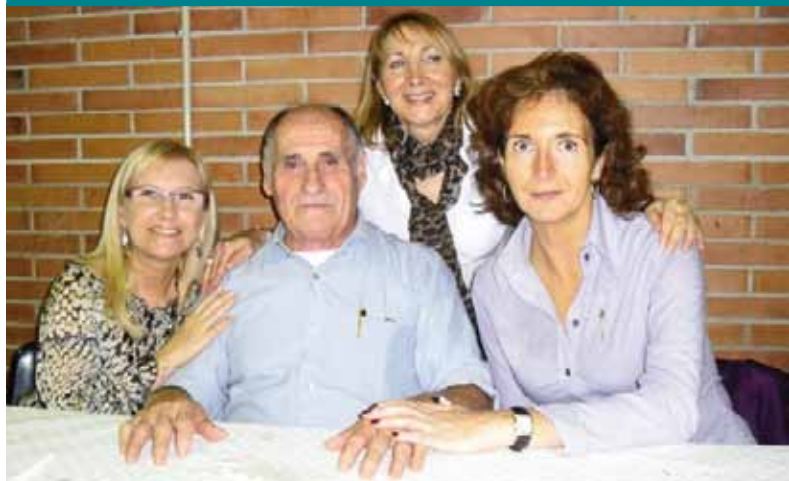
Potaje al Centre andalús de Bon Pastor