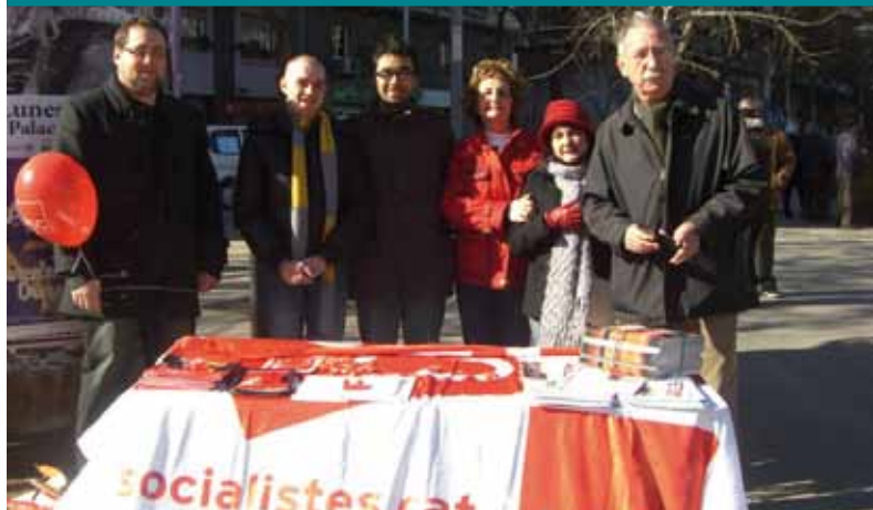
Equip Barri de Navas a una paradeta