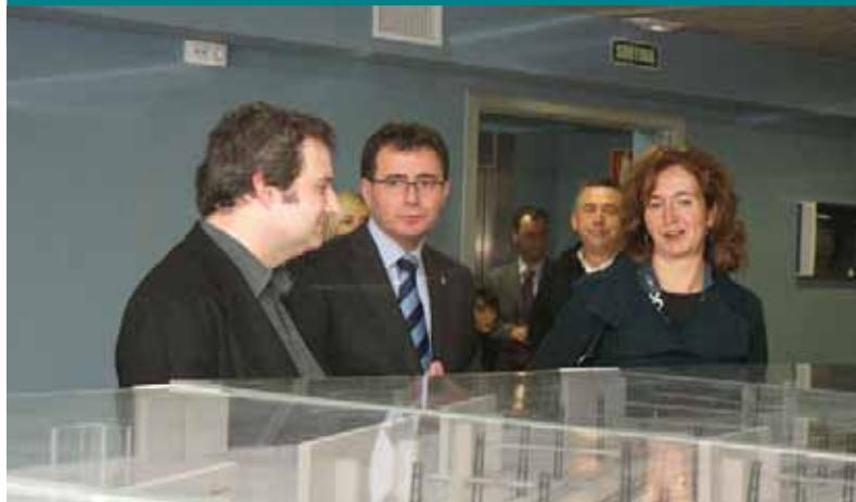
Copa del Rei al Club Natació Sant Andreu amb l'alcalde i la regidora