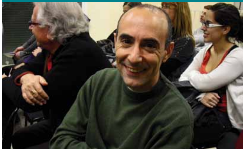
Jornada sobre les diferències entre esquerra i dreta