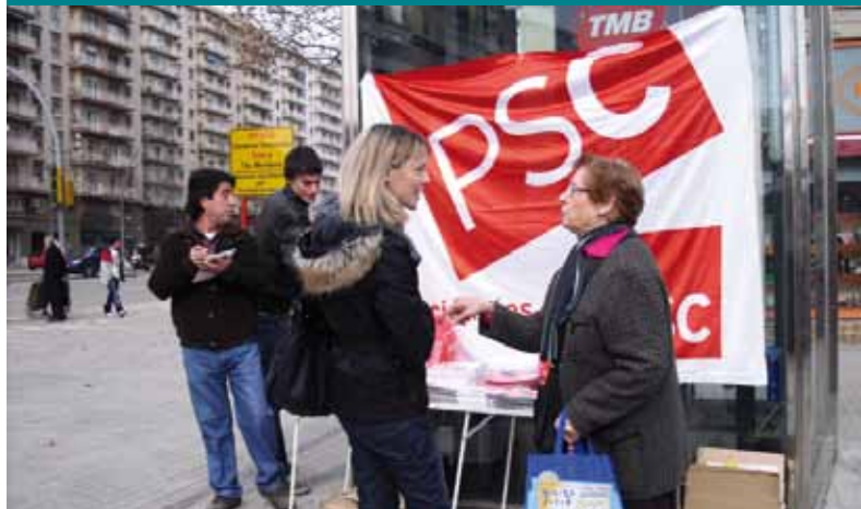
Paradeta a la Sagrera