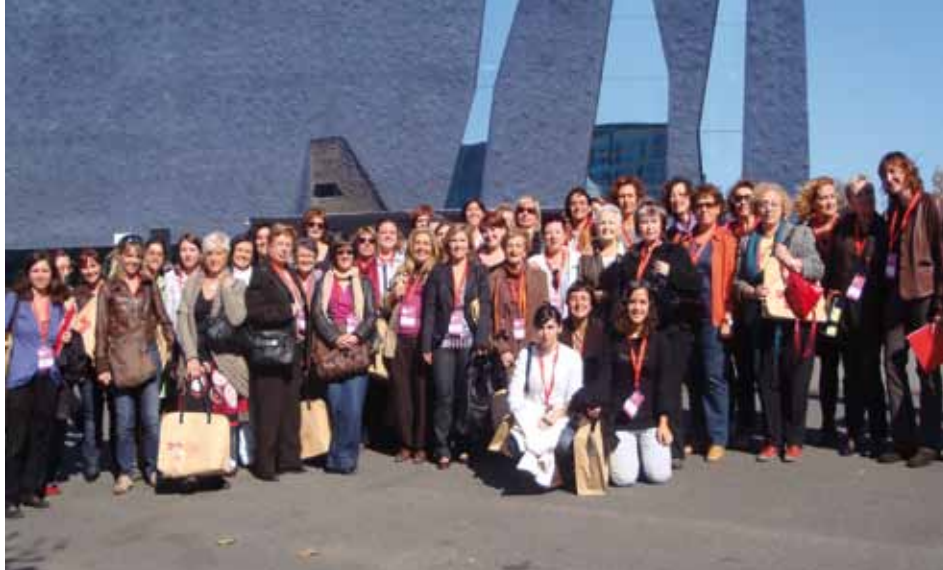
Les nostres dones al II Congrés de la Dona de Barcelona